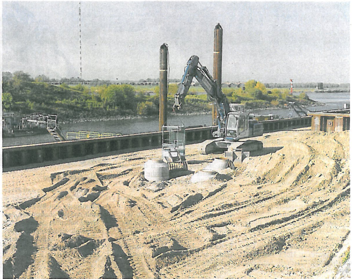
Die Arbeiten zum Verfüllen des ehemaligen Hafenbeckens liegen in den letzten Zügen. Bald kann das Traditionsunternehmen Hülskens die Anlegemöglichkeiten vor seiner Haustür voll nutzen.

Das Vorhaben umfasst neben der Befestigung gegen ein weiteres Abrutschen und dem Bau der neuen Spundwand auch, die Entwässerung und Pflasterung der Fläche sowie den Bau einer Kranbahn. Das Kiesunternehmen Hülskens unterhält hier unter anderem eine Werkstatt. In der hatte es am Freitagnachmittag nach Wartungsarbeiten